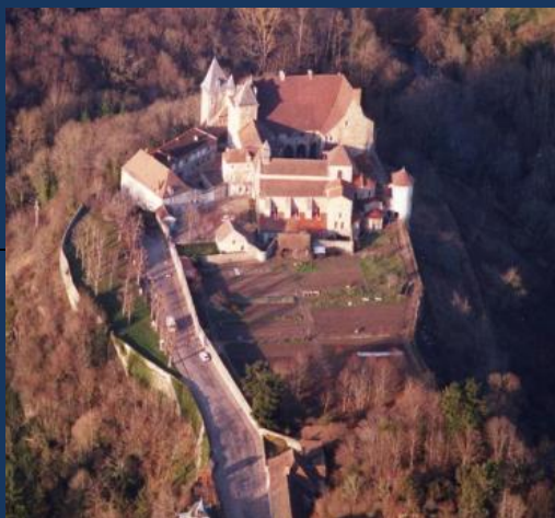
Emplacement de l'ancien château

À la Révolution, les religieux sont chassés et le prieuré est vendu comme bien national en 1794. En 1853, les bénédictines de l'abbaye de Pradines achètent la propriété et y fondent une communauté. Le pape Léon XIII érige le monastère en abbaye en 1890.