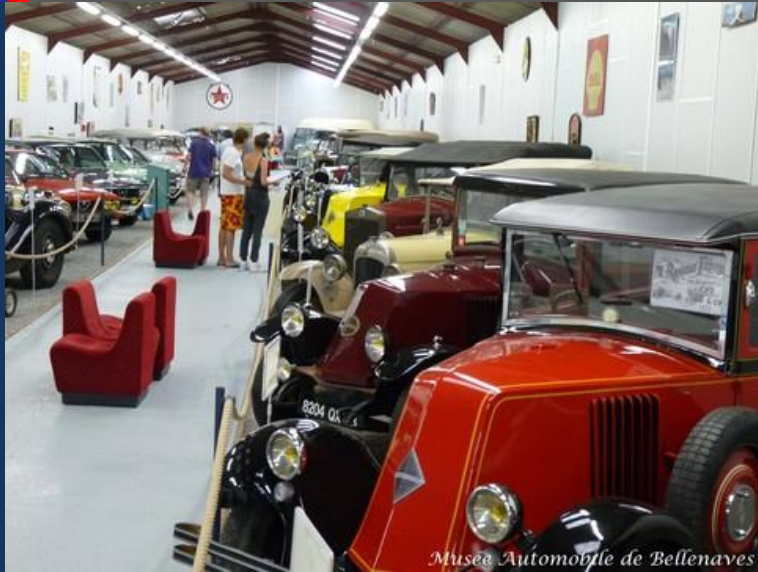
Musée Automobile de Bellenaves