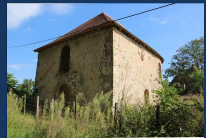
Chapelle du Petit Monceau