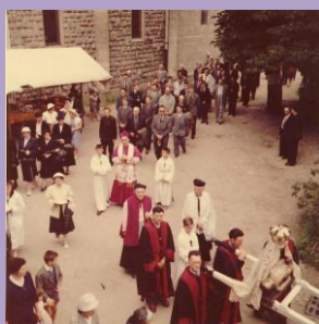
Pèlerinage à Notre Dame de Saint Germain des Fossés

Le 2 juillet se nomme dans le pays la petite fête. Une grand-messe est dite et le soir après les vêpres on processionnait autour du cimetière et de l'église [il s'agit de l'église du prieuré].