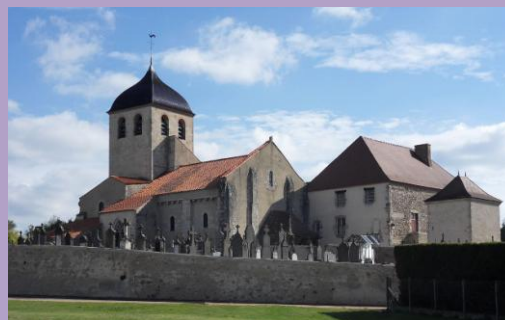
Eglise Notre Dame de Saint Germain des Fossés

Statue retrouvée par des mariniers dans le lit de l'Allier (probablement précipitée dans le fleuve à l'époque des guerres de religion (troubles dans la région : 1568-1576). À l'époque révolutionnaire, la statue fut abîmée (sont brisées les jambes de la statue, la tête, le bras droit et les jambes du Christ). La statue est ensuite cachée par des fidèles et replacée ensuite dans l'église du prieuré, après une réfection sommaire. Elle a été repeinte en 1896, pour les fêtes du couronnement (2 juillet 1896). Depuis 1994, la statue demeure dans la basilique.