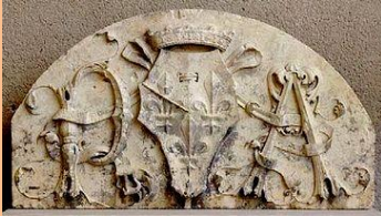
Lettres P et A (Pierre et Anne de Beaujeu Musée de moulins)

Pendant toute sa vie, il fut, avec sa femme un mécène actif. Il protégea ainsi le Maître de Moulins (Jean Hey). Il fit reconstruire une partie des châteaux de l'État bourbonnien, comme celui d'Aigueperse ou celui de Moulins.