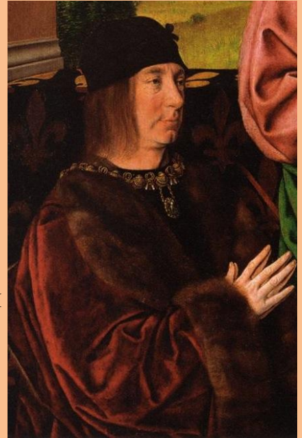
Pierre II (Tableau de Jean Hey)