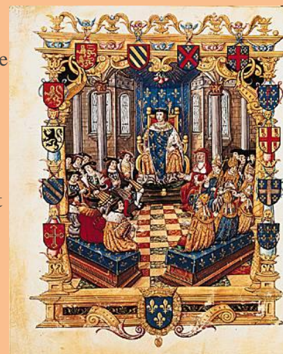
Procès du Connétable

la Ville éternelle à sac. Il ne verra pas la fin de cette guerre, conclue par la «paix des Dames» (3 août 1529).