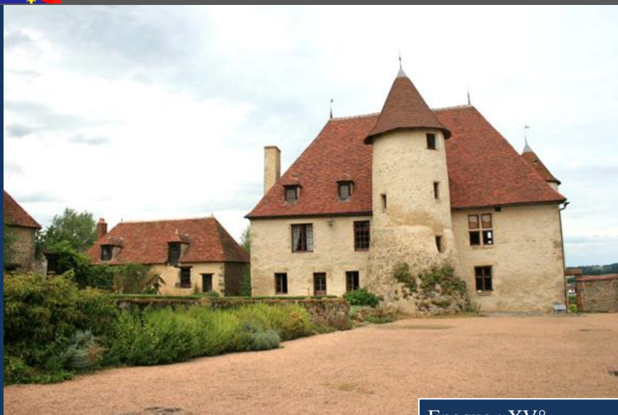
Un château authentique

Epoque : XV° Protection : ISMH (2010) Propriétaire : Monsieur et Madame Pince