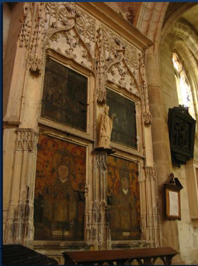
Armoire aux reliques

de 1905, la communauté gagna Aoste en Italie où elle s'éteignit. En 1990 des frères de la Communauté Saint-Jean arrivent à Souvigny pour redonner à la prieurale sa vocation première.