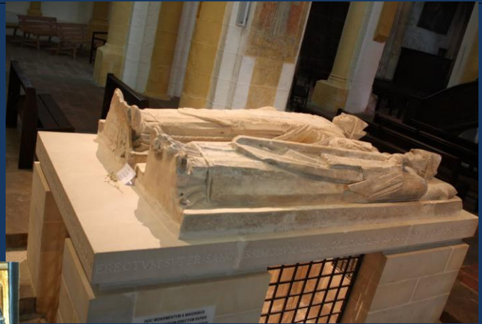
Saint Mayeul et Saint Odilon