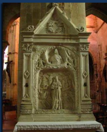
Le retable de l'Immaculée Conception.

Des 1432, Dom Geoffroy Chollet, moine du Mont Saint-Michel nommé prieur de Souvigny de 1424 à 1454, s'attache à restaurer l'église romane qui était dans un lamentable état et le cloître. Des marchés de travaux sont passés avec les architectes du duc de Bourbon, Maignon puis Poncelet, pour la reprise du chœur, de la voûte centrale, du bas-côté sud et de la façade occidentale. À la fin du XVe s, les ducs de Bourbon font élever une seconde chapelle funéraire avec l'intervention de grands imagiers de l'époque ; on procède alors à une seconde translation des corps des saints abbés de Cluny dans l'Armoire aux Reliques, exemple rare de ce type de meuble-reliquaire en France. À cette époque, de grandes écoles de sculptures travaillent à Souvigny : on doit à l'un des élèves de Jacques Morel une Sainte Marie Madeleine considérée comme l'une des pièces maîtresses de l'art flamboyant en France (1er moitié du XVe s.), puis à Michel Colomb un groupe à l'Enfant et une mise au tombeau. Ce fut la restauration gothique telle que nous la voyons aujourd'hui : un édifice religieux remarquable, de 89 mètres de long, 5 nefs, 6 travées, 28 mètres de large et une voûte aux nervures ouvragées, à 18 mètres de hauteur.