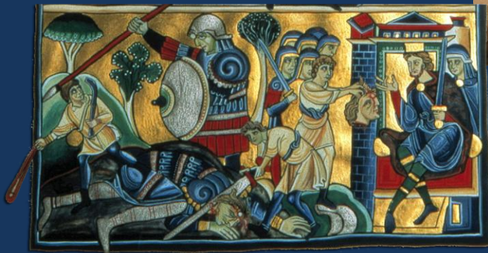
La Bible de Souvigny