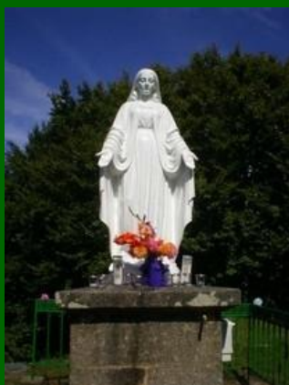
Notre-Dame de la Montagne Rocher Saint Vincent

Guidés par une table d'orientation, vous pourrez admirer le bassin Vichyssois, la chaîne des Puys, mais également la région de Bourges et les Alpes du Sud. Lieu d'escalade par excellence, le Rocher Saint Vincent est également chargé d'histoire, Le site particulier fut repéré comme particulièrement propice à la surveillance de la zone par les romains qui y établirent un oppidum. Avec également les ruines du Château de Puyramont, et de la chapelle dédiée à Saint Vincent Ferrier qui y prêcha il y a 600 ans, durant la Guerre de Cent ans. Aujourd'hui disparue, une statue dédiée à Notre-Dame de la Montagne se dresse à la place de cet édifice.